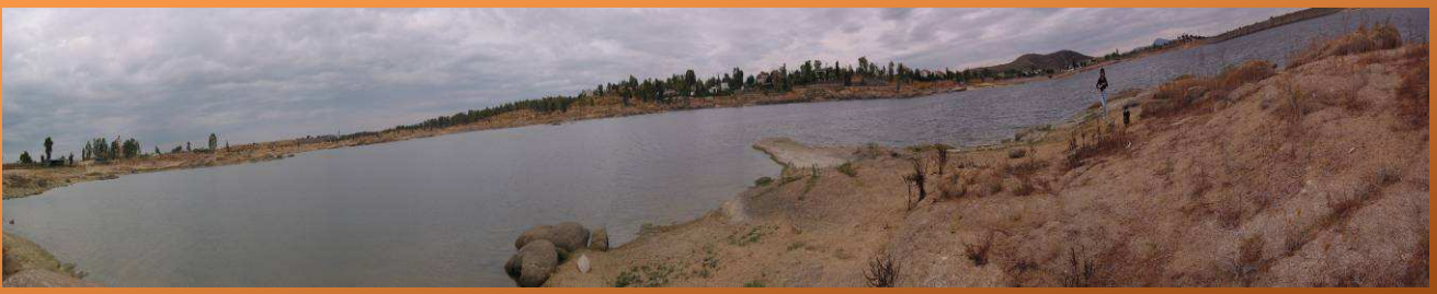
Embalse de Proserpina