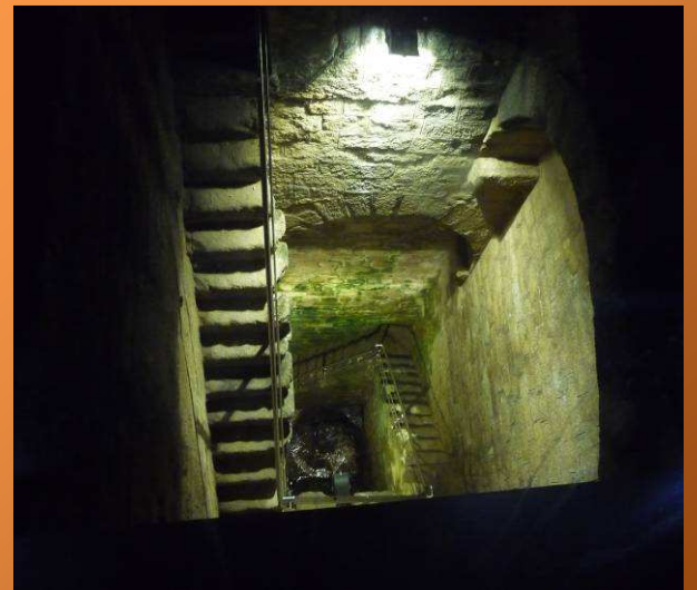
Interior del muro de la presa

Continuamos andando por la zona urbanizada de Proserpina y 1 kilómetro y 400 metros después cruzaremos el arroyo de las Pardillas por un puente, llegando a la abandonada ermita de san Isidro 130 metros más adelante.