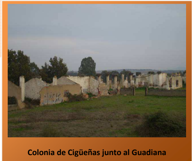
Colonia de Cigüeñas junto al Guadiana

Desde ahí podemos acercarnos cruzando la carretera y tomando el camino habilitado para pasear 375 metros a la derecha para llegar a un antiguo edificio en ruinas del que hablamos en la anterior ruta y que alberga una colonia de cigüeñas. La vuelta la haremos por donde vinimos.