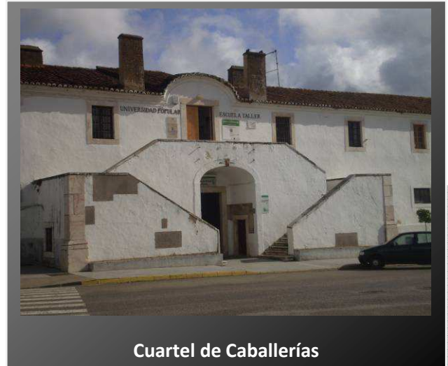
Cuartel de Caballerías

Es un edificio del siglo XVIII. En la mitad del edificio encontramos una escalinata para subir a los pisos superiores. Servía como dormitorios de la tropa. Posteriormente se utilizó como instituto, universidad popular. La parte baja fue utilizada como Centro de Salud y oficina de empleo.