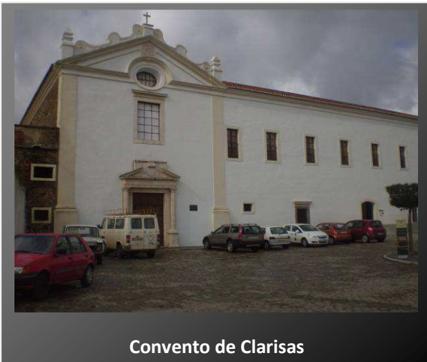
Convento de Clarisas

Posteriormente en 1833 fue utilizado como cuerpo de carabineros hasta 1940. Ya en tiempos actuales fue rehabilitado y se creó la Escuela Regional de Teatro y Danza. Actualmente tiene usos turísticos.