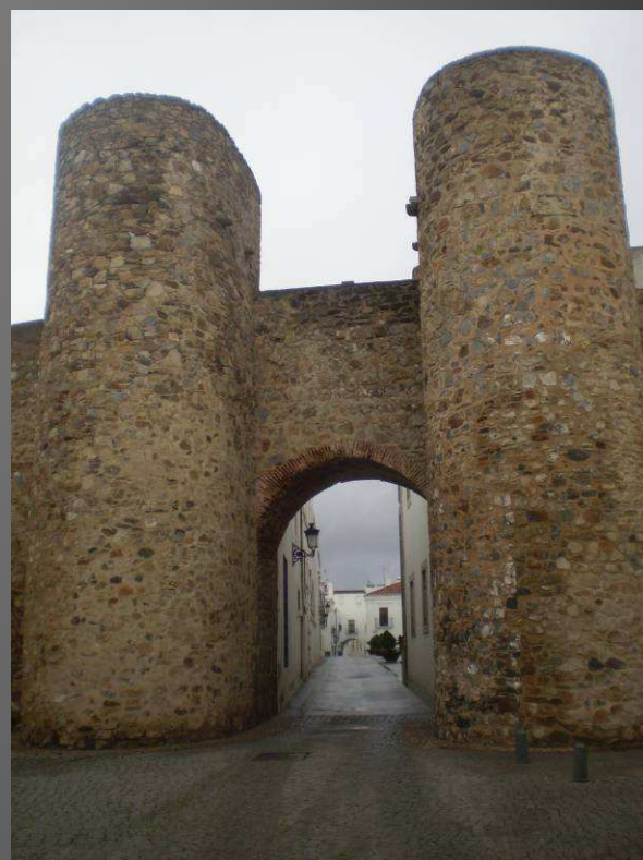
Museo etnográfico y puerta de Alconchel