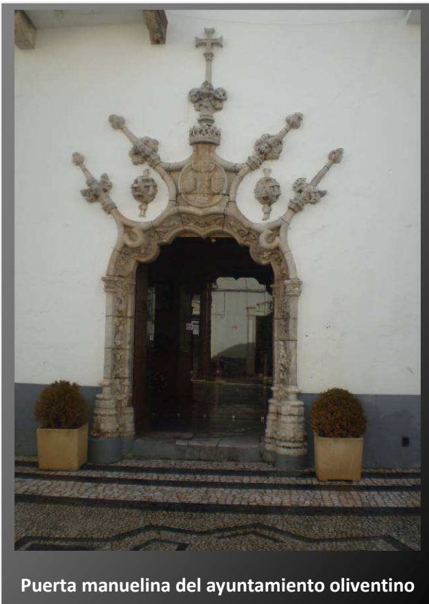
Puerta manuelina del ayuntamiento oliventino

Continuaremos adelante y llegaremos a la plaza de la Constitución en la que encontramos la sede del Ayuntamiento. Fue construido a mediados del siglo XV, a la derecha de la puerta de la Gracia. Aunque se le denomina palacio de los duques de Cadaval, nunca fue palacio, obedeciendo el nombre al hecho de que alguna vez fueron alcaldes mayores de Olivenza.