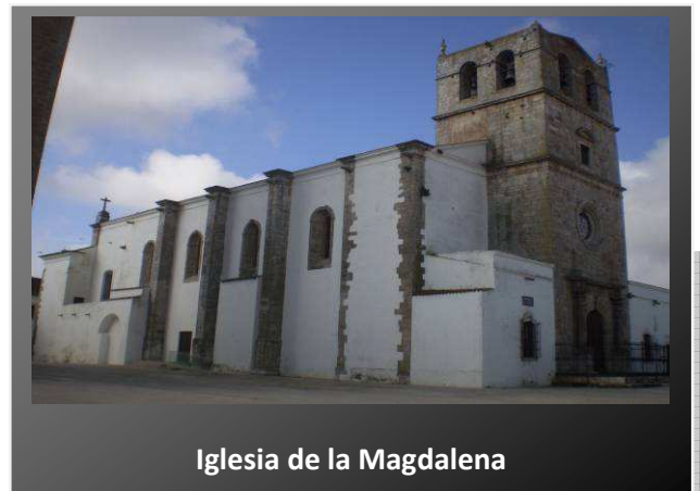
Iglesia de la Magdalena

Continuamos adelante y llegaremos a la iglesia de la Magdalena. La iglesia fue levantada en el siglo XVI para ser templo de los obispos de Ceuta. En ella se encuentra enterrado el primero de los obispos, Fray Enrique de Coimbra. Para la construcción de la iglesia se creó un impuesto denominado Renta de la imposición que gravaba la venta de pescado, carne y aceite.