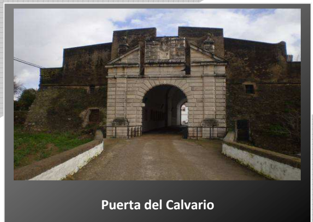
Puerta del Calvario

Continuaremos nuestro paseo por la calle Díaz Brito y el paseo Pizarro hasta llegar a la puerta del Calvario que forma parte de la fortificación abaluartada, construida en el XVII para las Guerras de Restauración.