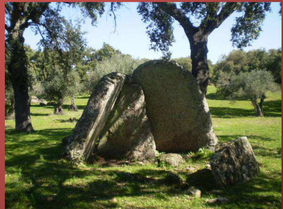
Dolmen "El Alcornocón"

150 metros más adelante y encontraremos el dolmen "Juan Durán I".