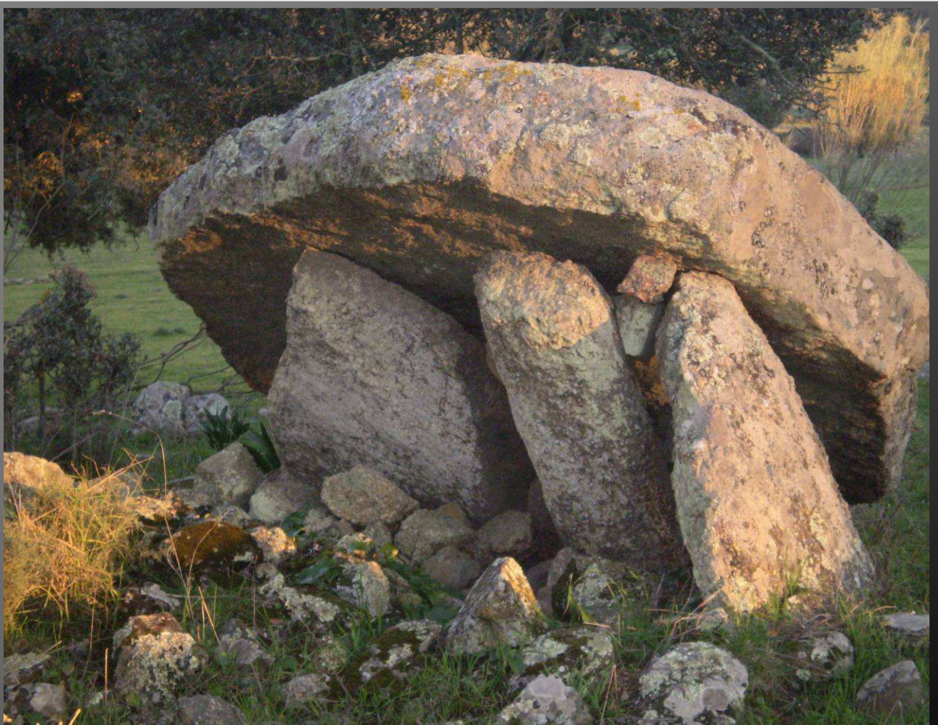
Dolmen "La Rana"