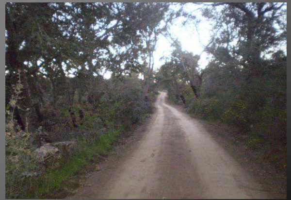
Senda de regreso al cortijo del Milano

Volveremos nuevamente a la cañada y buscaremos una senda que sale casi en la horizontal del lugar en el que encontramos el dolmen de la rana. Por ese camino iremos durante 1 kilómetro y 800 metros hasta llegar nuevamente al cortijo del milano.