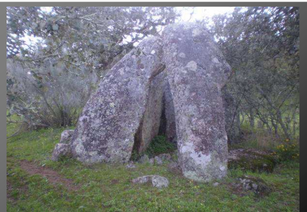
Dolmen "San Blas"

Pasaremos junto a una casa y buscaremos a la izquierda la línea de la tapia. Aproximadamente 670 metros después, a mitad de la sierra encontramos el dolmen.