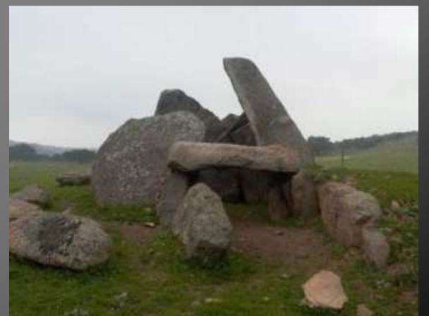
Dolmen "El Milano"

un patio y junto a unas naves, encontramos el dolmen "El Milano" apartado en el patio y cercano a un muro. Una desafortunada rehabilitación de este dolmen conllevó su desmoronamiento. Los dueños de la finca son muy agradables y no ponen ningún reparo para poder visitarlo.