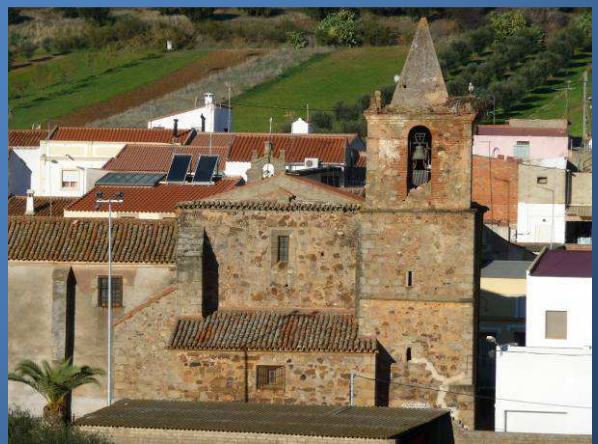
Iglesia de la Natividad

Continuamos 830 metros adelante llegando junto a un pozo que es alimentado por tres arroyos: el de la moneda, el de la Peña y el de la Silla.