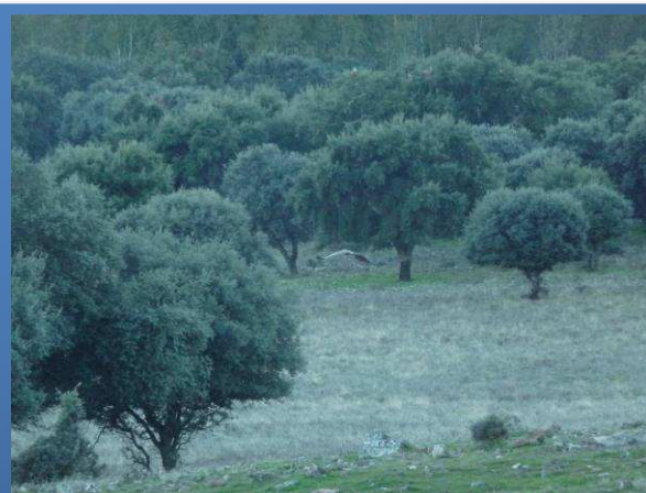
Buitres en la sierra de la Moneda

Zigzagueando por la sierra, iremos avanzando durante 2 kilómetros y 400 metros. Ahí tomamos el camino de la derecha y continuamos adelante.