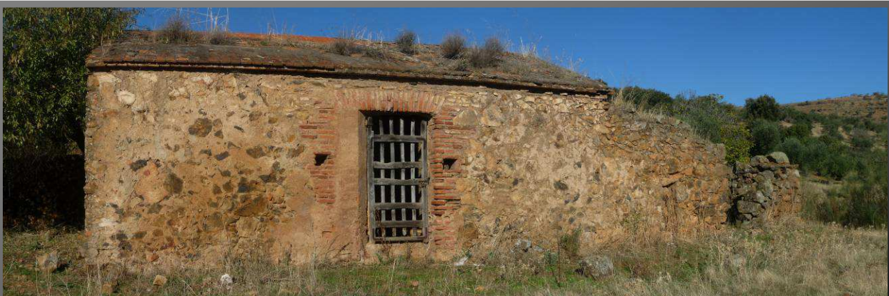
Lazareto del siglo XIX próximo a la localidad de Feria

Feria: Iglesia de San Bartolomé (s. XV), rincón de la Cruz (s. XX); castillo fortaleza de Lorenzo Suárez de Figueroa (s. XIV); ermita de los Santos Mártires (s. XVIII), dolmen de la Casa del Monje, casa del Concejo, Lazareto (s. XIX).