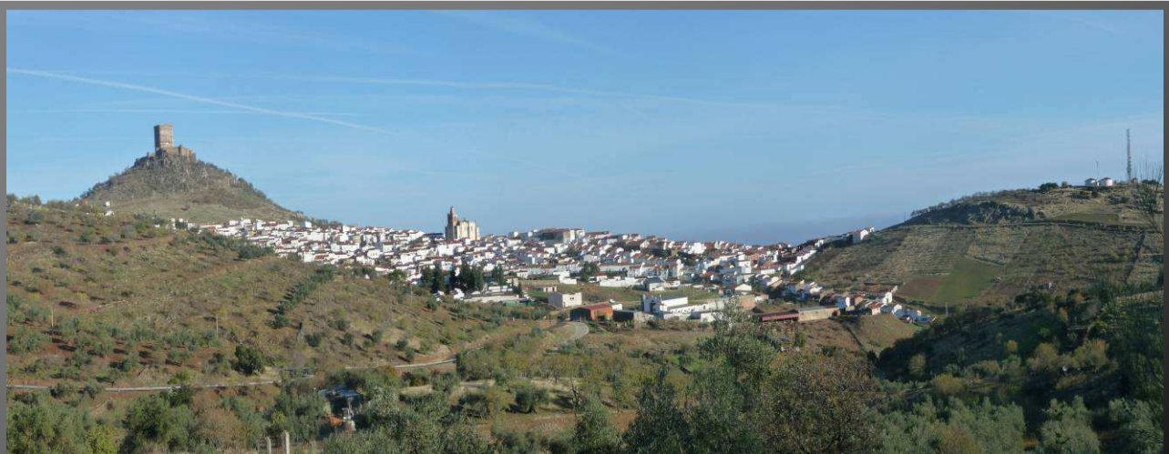
Panorámica de la ciudad de Feria