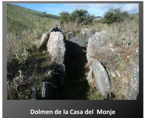
Dolmen de la Casa del Monje

Se trata de un sepulcro de cámara poligonal compuesto por siete grandes lajas de pizarra apoyadas y reforzadas por otras de menor tamaño. Fue utilizado como refugio de pastores durante mucho tiempo, que le dieron el nombre de "Casa del Monje".