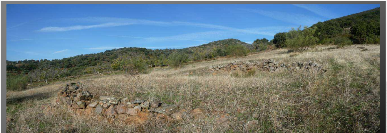
Era de Trillar cereal. La nivelación del terreno está super ajustada

La vuelta la podemos hacer hasta coger el primer camino por el que nos desviamos que es el callejón de Sevilla o como hicimos nosotros (solamente si llevamos el GPS), continuar hasta unos fresnos junto al arroyo de las Viñas.