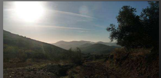
Horno de cal y Callejón de la zorra