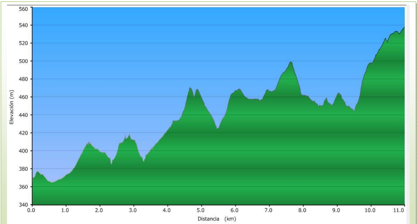
PERFIL RUTA PORTEZUELO A CONVENTO DEL PALANCAR