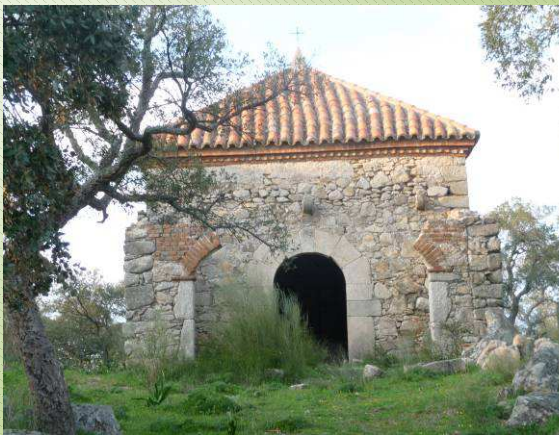
Ruinas Ermita de Santa Bárbara

Tomamos el camino del Berrocal (dejando atrás y a la Derecha la charca y a 180 metros a nuestra izquierda veremos un caminito que nos lleva a las ruinas de la Ermita de Santa Bárbara.