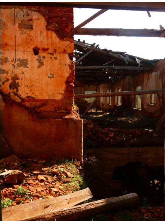
Interior del Molino del Tío Fabián

500 metros desde que tomamos el camino, vamos a ver a nuestra derecha un edificio muy grande en ruinas y que es conocido como el molino del tío Fabián. Se trata de un antiguo molino de cereales que posteriormente funcionó como telar y que tiene una particular estructura con grandes arcos, canalizaciones de agua y un gran muro que impedía el paso a su interior. En el interior del molino, aun queda algún resto de la maquinaria.