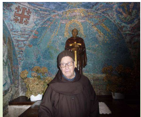
Al fondo imagen de San Pedro de Alcántara y delante del altar (lo único que se conserva del siglo XVI), un fraile franciscano de 87 años

La visita al convento es imprescindible. Da igual el sentimiento religioso que uno tenga, se respira paz, tranquilidad y sosiego en cualquiera de los rincones. Fue fundado en 1557 por el propio San Pedro de Alcántara (que fue bautizado como Juan Garavito de Sanabria, aunque cuando tomó hábito lo cambió por el de Fray Pedro de Alcántara), siendo de minúsculas proporciones.