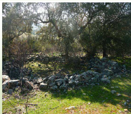
Asentamiento Romano "La Macadilla"

Cuando llevemos 2 kilómetros y 300 metros, vamos a encontrar un camino que lo cruza y que debemos tomar a nuestra derecha aunque antes de hacerlo, podemos acercarnos a las ruinas del asentamiento romano de la Macadilla que vamos a encontrar unos 300 metros adelante y que están en una pequeña loma al lado de un caserío en ruinas. Para acceder al asentamiento tendremos que saltar una valla.