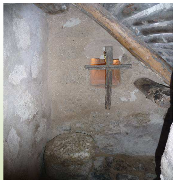
Celda de San Pedro