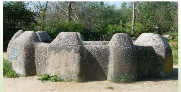
Pozo en forma eneagonal en Riobos

En Riobos podemos acercarnos a la iglesia de Santa Catalina (siglo XVI) y volver hasta la Cañada real por donde hemos venido, o bien hacerlo cruzando el arroyo del Boquerón del Rivero por un puente en el que la base tiene toda la apariencia de ser muy antiguo pero que en alguna reconstrucción del pasado siglo le añadieron ladrillo y vigas dejándolo en una fea apariencia.