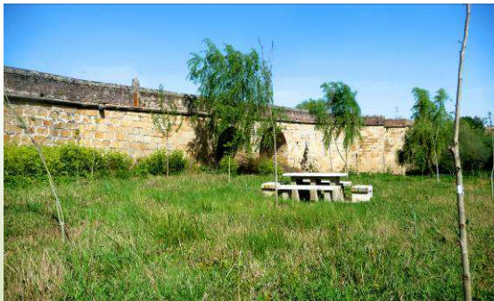
Puente medieval sobre el Jerte en Galisteo

un puente medieval del siglo XVI (tendremos que desviarnos un poco) y si tenemos fuerzas, subir a ver la muralla almohade del siglo XI, el ábside mudéjar, así como las distintas puertas de acceso a la villa (la ruta 6 la hemos dedicado a esta bonita localidad).