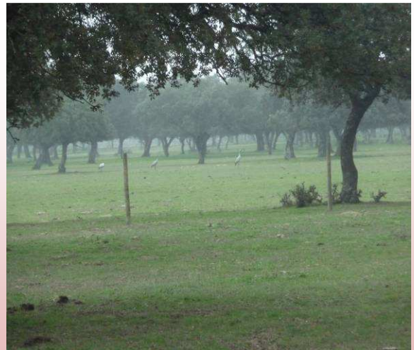
Grullas en la Dehesa de Rosalejo

Llegamos a un camino asfaltado que tomamos a nuestra derecha y tras andar 120 metros, tomaremos el que sale a nuestra izquierda que está rodeado de arbolado adhesionado conocido como Camino del Corcho Tendero.