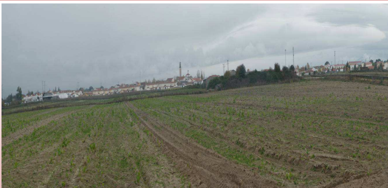
Panorámica de la localidad de Rosalejo

Rosalejo: Rollo o Picota, procedente del pueblo del que proceden la mayoría de sus habitantes, Talavera la Vieja, actualmente bajo las aguas del río Tajo en el embalse de Valdecañas