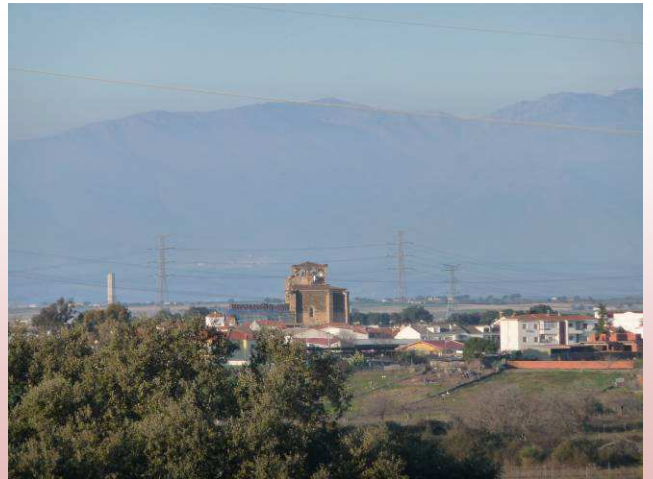
Almaraz, Iglesia de San Andrés y Gredos

A 160 metros de la cancela nos cruza un camino conocido como Camino Viejo y lo tomamos.