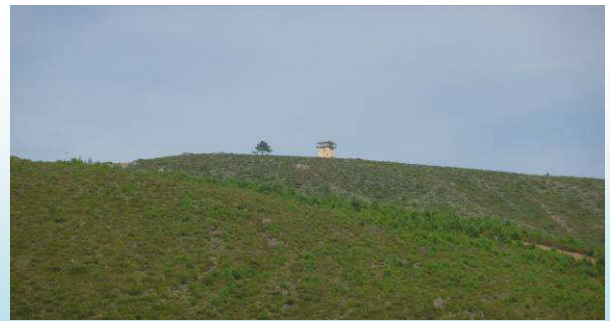
Puesto de vigilancia de Haycepo

Tomaremos el camino que rodea el Lomo del Horcajo a nuestra izquierda por una pista desde la que vamos a tener una buena visión del río Avellanar y de la sierra del Cotorro. Desde esta panorámica veremos también el refugio de Haycepo, un lugar desde el que por su dominancia se localiza rápidamente la existencia de algún fuego.