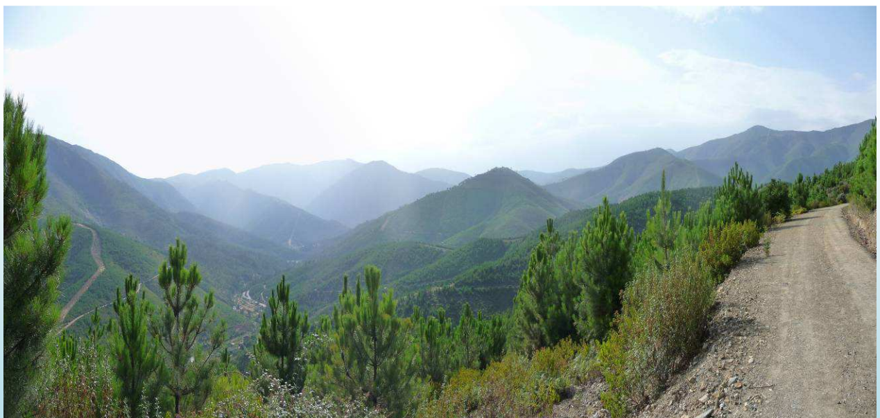
Sierra del Fortín (con su clásico relieve Apalachense)

Avellanar: Lagar de Aceite; piscina natural en el río Esperabán