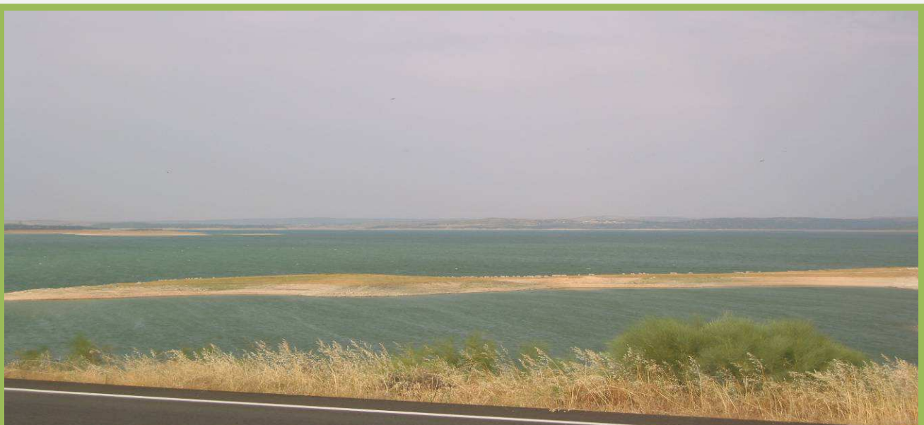
Embalse de Valdecañas desde la carretera

Desde ahí, la vuelta la haremos por el mismo sitio por el que vinimos aunque si tenemos la posibilidad de que nos recojan seguramente sea mejor idea que tener que recorrer la carretera nuevamente.