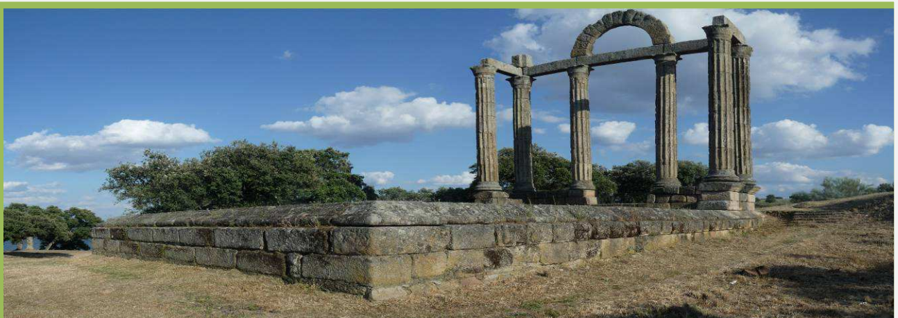
Pórtico romano de Curia "Los Mármoles"

No es este su sitio original ya que estuvo con anterioridad en la localidad de Talavera la Vieja que, en 1963 fue inundada por las aguas del embalse de Valdecañas. Con anterioridad se trasladó el monumento junto a tres columnas pertenecientes al templo de la Cilla que se situaba al lado del pórtico de Curia.