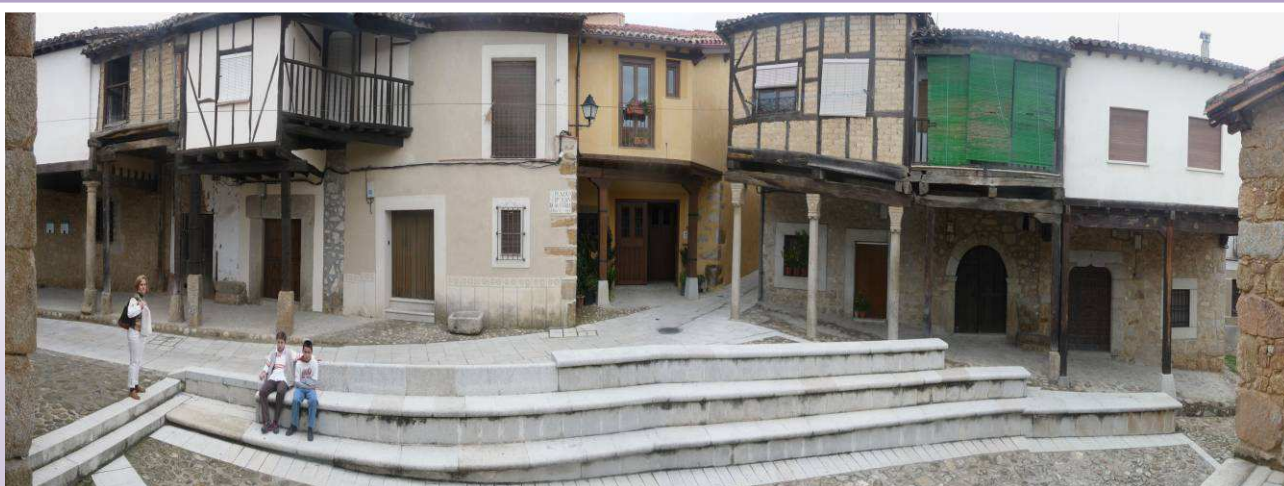
Panorámica de la plaza "Juan de Austria" en Cuacos de Yuste

Cuacos de Yuste: Conjunto Histórico Artístico. Monasterio y Palacio de Yuste (s. XVI). Cementerio alemán. Gargantas de Cuacos, Jaranda y Pedro Chate. Iglesia de N o Sra de la Asunción (s. XV) declarada Monumento de Interés Cultural. Plaza Juan de Austria. Plaza de España. Fuente de los Chorros. Fuente de la Higuera. Puente romano.