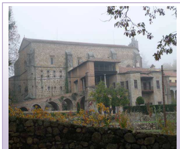
Monasterio de Yuste

En un principio es una pista de cemento, posteriormente se convertirá en una pista de tierra. Subiremos la pendiente hasta llegar a cruzarnos con el camino del Baldío que tomaremos a la izquierda e iremos bajando hasta llegar al monasterio.