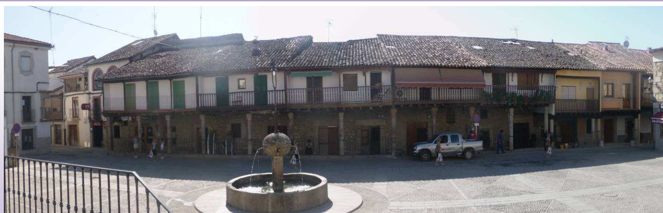
Plaza porticada de Cuacos de Yuste

Desde la plaza podemos ver la parroquia de Nuestra Señora de la Asunción, del siglo XV, declarada monumento de interés cultural con un bello retablo neoclásico.