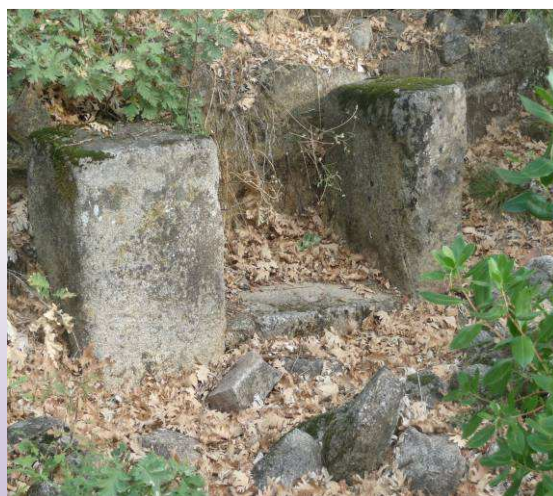
Ruinas de la ermita de San Pedro. Altar

Descendemos y cuando llevemos 1,8 kilómetros, a nuestra izquierda vamos a ver un pequeño cerrito y a la mitad encontramos las ruinas de la ermita.