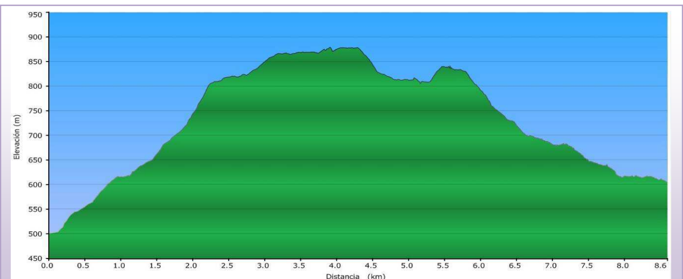
Perfil ruta Garganta “La Desesperá” en Arroyomolinos de la Vega”