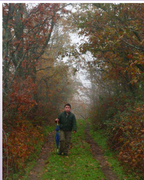
Robledal en el camino finalizando la Colada

Ahí termina la colada. Tomaremos el camino de la derecha y entraremos en un robledal.