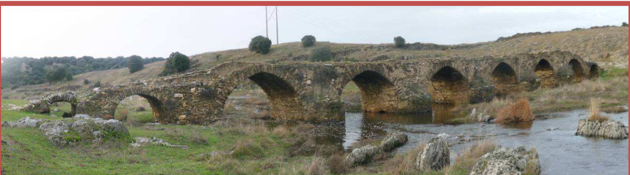
Panorámica del puente de la Lavadera sobre el río Tozo

710 metros después de tomar el nuevo camino cruzaremos otra canadiense y siguiendo 550 metros pasaremos por una granja. 830 metros más adelante tomaremos el camino de Doña Catalina, al que nos incorporaremos por su izquierda. Desde ahí entramos a Aldea del Obispo pasando por la fuente del Templete, desde ahí iremos a la iglesia del Rosario y el palacio del Obispo donado por Fernando III al Obispo de Plasencia.