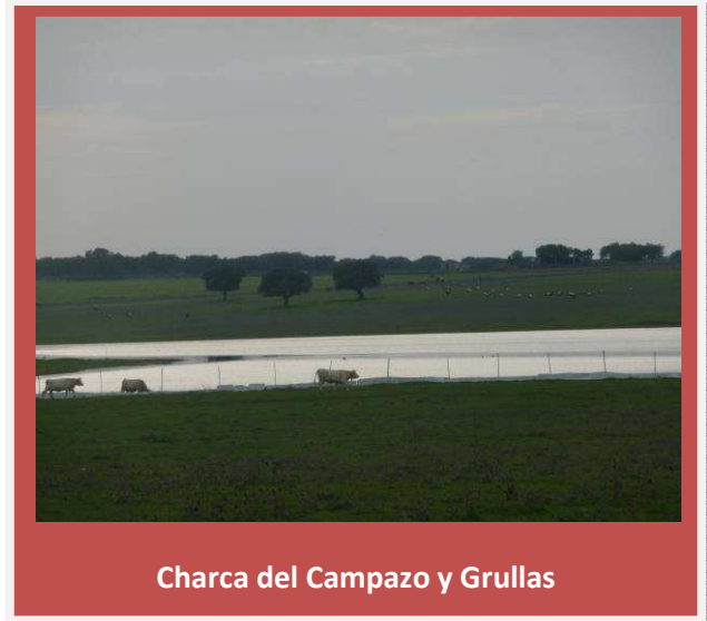
Charca del Campazo y Grullas

680 metros después llegaremos a un cruce de caminos. A la derecha encontraremos la granja del Campazo y a la izquierda la charca del Campazo. Si es temporada de invernada de grullas es fácil que podamos encontrarlas por la charca o en la Dehesa del Campazo. Nosotros continuaremos adelante.