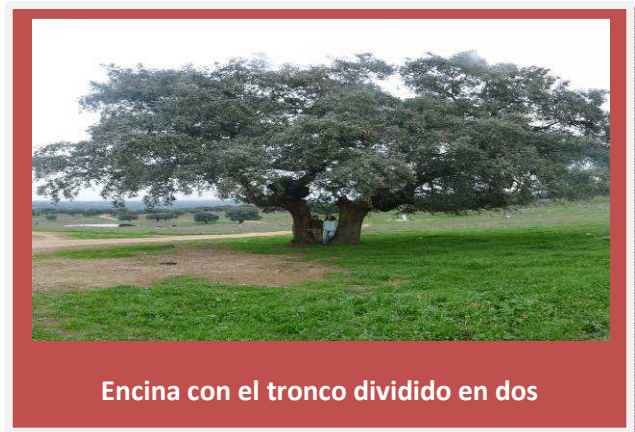
Encina con el tronco dividido en dos

A unos 620 metros encontramos un cruce de caminos. A la izquierda el camino que sale es el cordel del Puente de la lavadera. Encontramos también una granja y una curiosa deformación en una encina con el tronco dividido en dos partes.