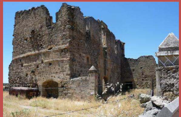
Casa de los Pizarro

160 metros después encontraremos un segundo pozo. Continuaremos adelante y llegaremos a Conquista dirigiéndonos por la calle Calvo Sotelo y General Yagüe hasta la iglesia de San Lorenzo Martir. Desde ahí tiramos por la carretera en dirección a Garciaz y nos desviamos por la calle Francisco Pizarro hasta llegar a las ruinas del palacio de los Pizarro, construido para que fuera una de las residencias del conquistador en el siglo XVI aunque al final no llegó a habitarla.