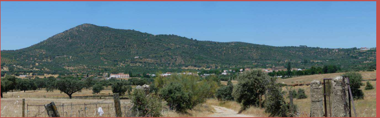
Sierra de los Lagares y localidad de Herguijuela