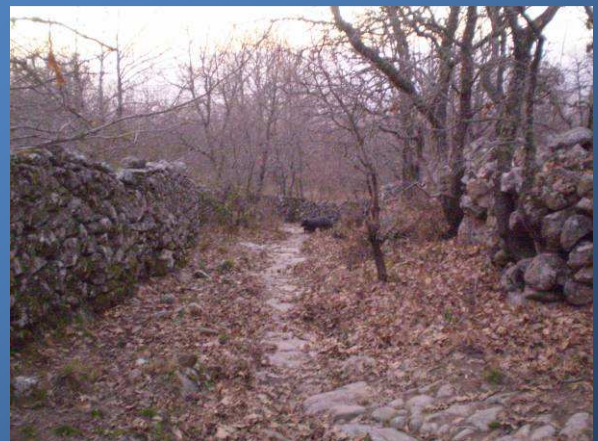
Parte del paso lo haremos por calzadas

Este camino lo llevaremos 800 metros y justo ahí, abandonaremos el camino que traemos y nos introduciremos a la derecha por un bosque de castaños.