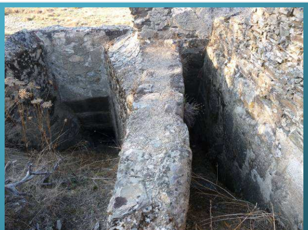
Canalización de agua al molino