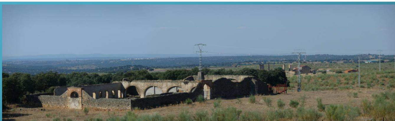
Edificios principal de la Mina "La Liebre"