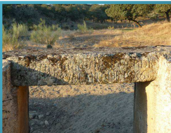
Inscripción en el "Puente Carvajal"

A 210 metros giramos a nuestra izquierda (a la altura de un antiguo pozo comunitario) y tomamos una carretera para dejarla casi de inmediato a la derecha tomando esta vez el camino de Cáceres a Plasenzuela.