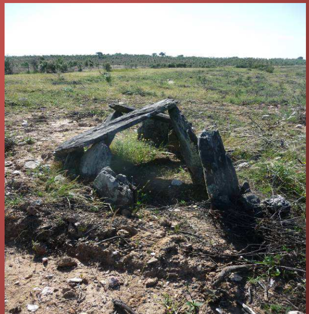
Dolmen Fuente de la Sevillana

Unos metros más allá debe estar la fuente de la sevillana (el cartel indica que 200 metros hacia el río Sever que hace límite de término con Santiago de Alcántara).