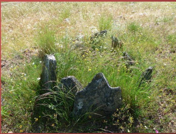
Dolmen Era de los Guardas

Es un dolmen muy pequeño y las hierbas que han dejado crecer lo tienen casi cubierto. Hay quien lo relaciona con el domo de la Charca como un complemento a éste.