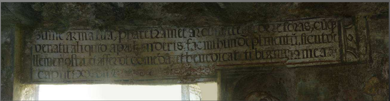
Inscripción en latín en la ermita

Todavía no bien repuesto del sobresalto por el estado de abandono de la ermita de el Salvador, continuamos nuestro camino volviendo sobre nuestros pasos hasta llegar de nuevo a la casa de Mudaelpelo. Desde ahí sale un camino justo a la izquierda del que trajimos por el que continuaremos el paseo.