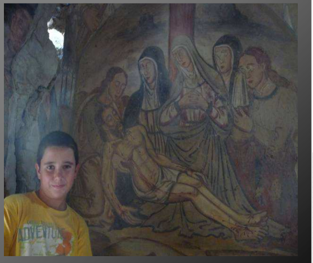
El descendimiento de la Cruz