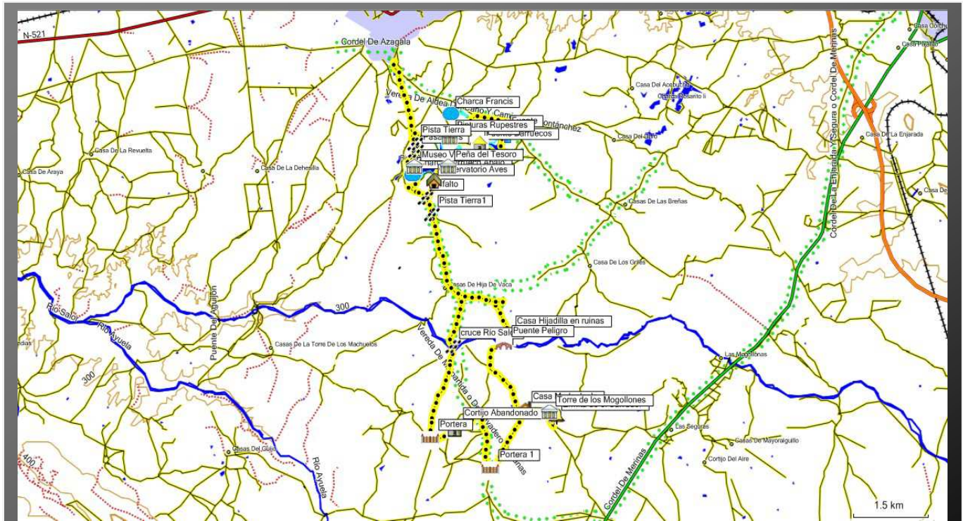
Mapa Vereda de Malpartida o del Lavadero de Lanasy Colada de la dehesa Boyal en Malpartida de Cáceres