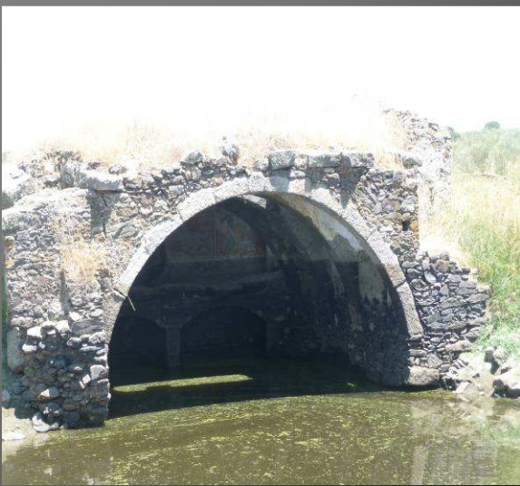
Ermita de "El Salvador" o de San Jorge