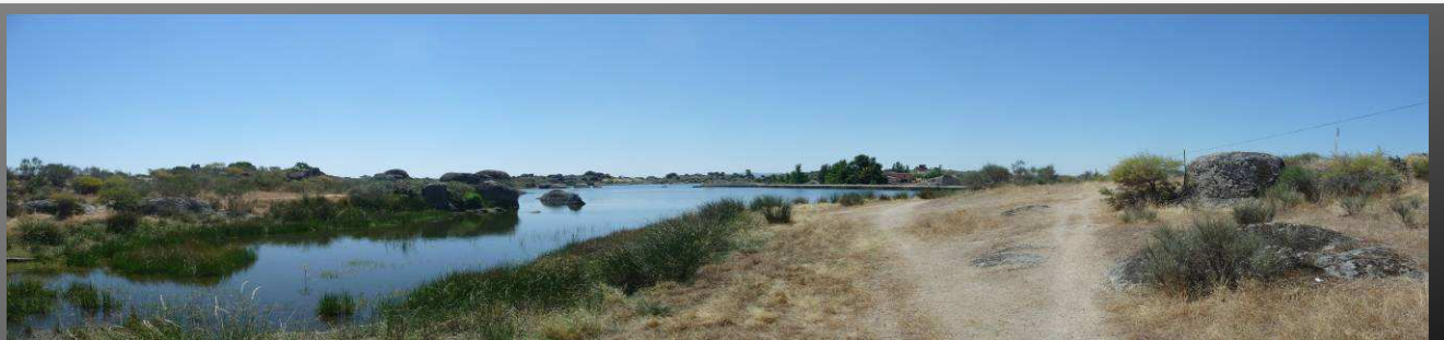
Charca de los Barruecos de Abajo

Situados ya en el río Salor, podríamos continuar la vereda de Malpartida que sale justo a la izquierda, pero está tan borrado el camino que en bicicleta se hace casi imposible seguirlo, por lo que tomamos el camino que sale al frente y que es conocido con el nombre de camino de Malpartida a Puebla de Obando.