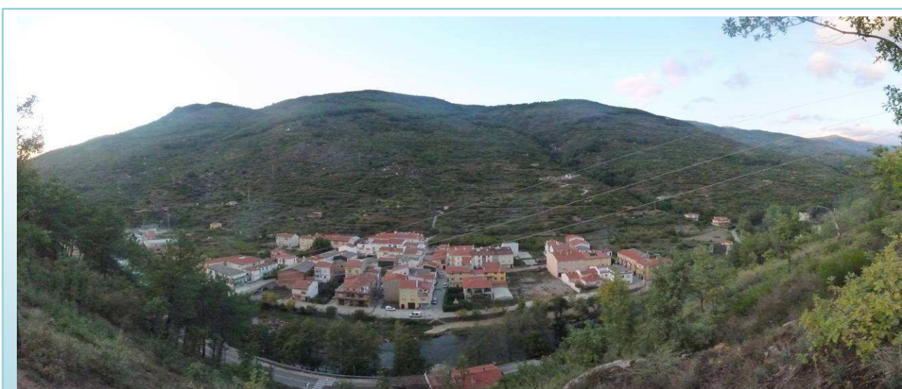
PANORÁMICA DE NAVACONCEJO Y A LA DERECHA GARGANTA "NOGALERAS"

Navaconcejo: Casas con balcones voladizos y aleros. Garganta de las Nogaleras. Fábrica de telares (s. XVII). Ermita Barroca del Santísimo Cristo del Valle. Ermita de San Jorge, con retablo del s. XVIII. Iglesia de Nuestra Señora de la Asunción (s.XVI). Picos de Camocho y Peña de San Blas