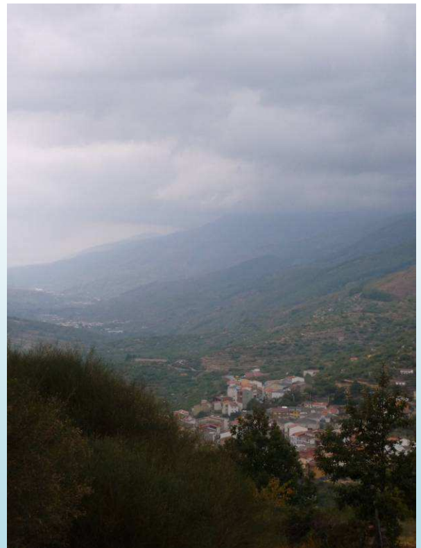
Tornavacas y Valle del Jerte

A 1 kilómetro y 100 metros llegamos junto a la carretera y tomamos el camino que sale a la derecha.