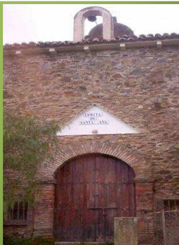
Ermita de Santa Ana (Siglo XVIII)

Comenzamos nuestro paseo en la fuente existente al lado de la calle principal (en la carretera).